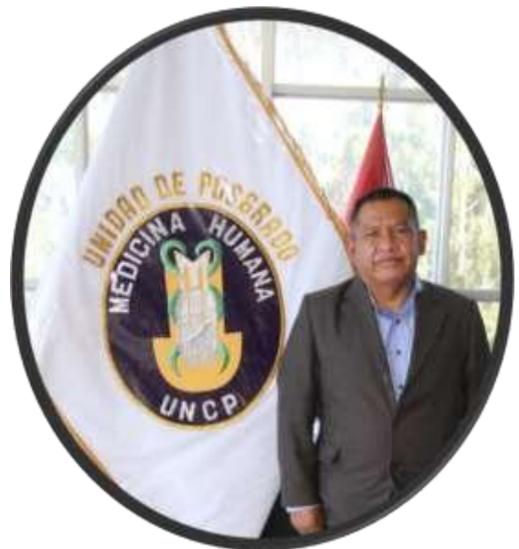
COORDINADOR ACADÉMICO DE LA UNIDAD DE POSGRADO FACULTAD DE MEDICINA HUMANA - UNCP