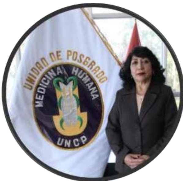
COORDINADORA ADMINISTRATIVA DE LA UNIDAD DE POSGRADO FACULTAD DE MEDICINA HUMANA - UNCP