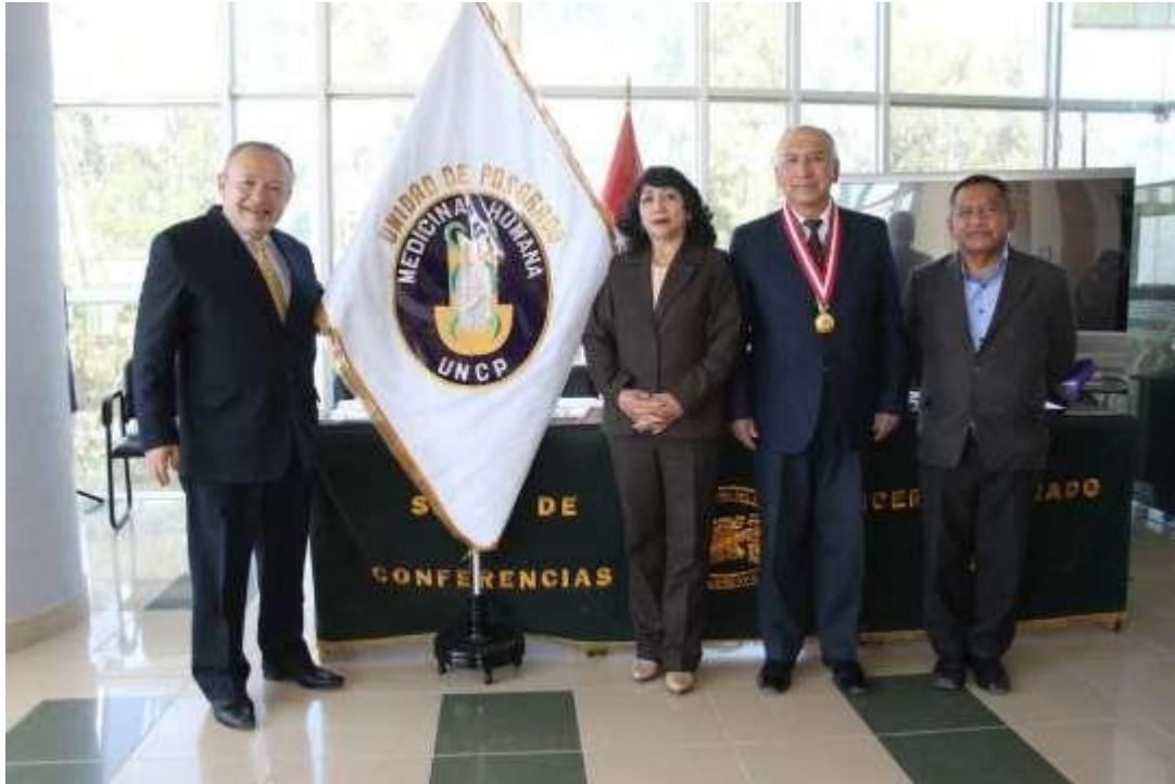
DECANO DE LA FACULTAD DE MEDICINA HUMANA - UNCP